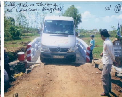
Brücken in abgelegenen Gegenden für Infrastrukturaufbau

Eine feste Betonbrücke kann innerhalb von drei Monaten gebaut werden, als Ersatz für eine behelfsdürftige Brücke aus Holz- oder Blechbrettern, die nach ein paar Jahren vom Hochwasser weggespült wird. Die Betonbrücke eröffnet den Einwohnern in dem betroffenen Landkreis neue